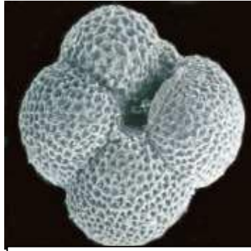
Globigerina Ø approximatif : 0,25mm photo fiche ECE